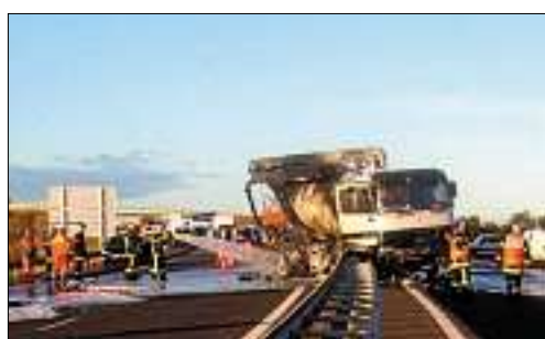
■ A l'origine du blocage, un accident à Tourbes.

Hier, la circulation a été interrompue de 7 h 30 à 18 h 30.