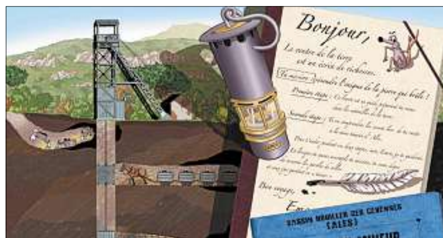
■ Sa brochure est remise aux enfants qui visitent la Mine témoin.