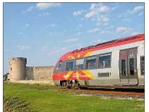
■ Du centre-ville de Nîmes au Grau-du-Roi, le train effectue le parcours en 50 mn. D. Q.

Trains d'été Quand le TER chemine en Petite Camargue