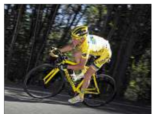
■ Tout devient difficile pour le Français, toujours en jaune. Aujourd'hui : le Galibier.

Tour de France La belle frayeur de Voeckler