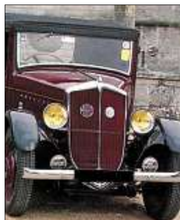
■ Mathis est une marque auto qui a produit de 1905 à 1940.

Cet engin se montait grâce à une manivelle considérable qui tendait un ressort colossal. Une aiguille semblable à celle des couturières, extirpait du disque des flonflons grésillants, mais suffisants pour donner envie de chanter et de danser. Ils avaient aussi une importante collection de soixante-dix-huit tours: cela fonctionnait encore il n'y a pas si longtemps, mais le diaphragme a rendu l'âme récemment. Sic transit, car on n'en trouve plus que par miracle.