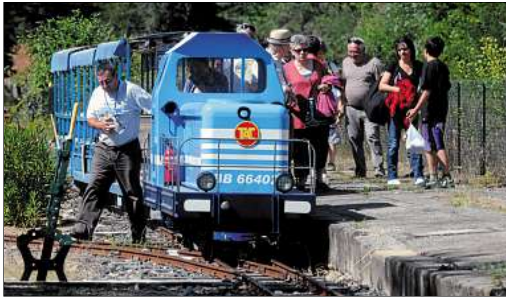
■ Le TAC emprunte le parcours de l'ancienne ligne de chemin de fer départemental.

● BOULES Concours de boules en semi nocturne tous les jeudis, à 21 h, au bar de la Placette. En doublettes avec 50 € de prix plus frais de participation.